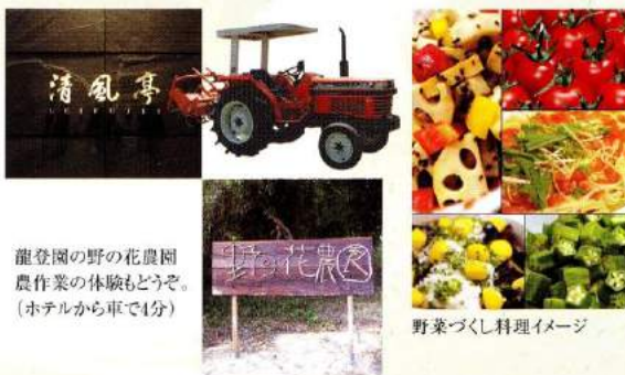
龍登園の野の花農園 農作業の体験もどうぞ。 (ホテルから車で4分)